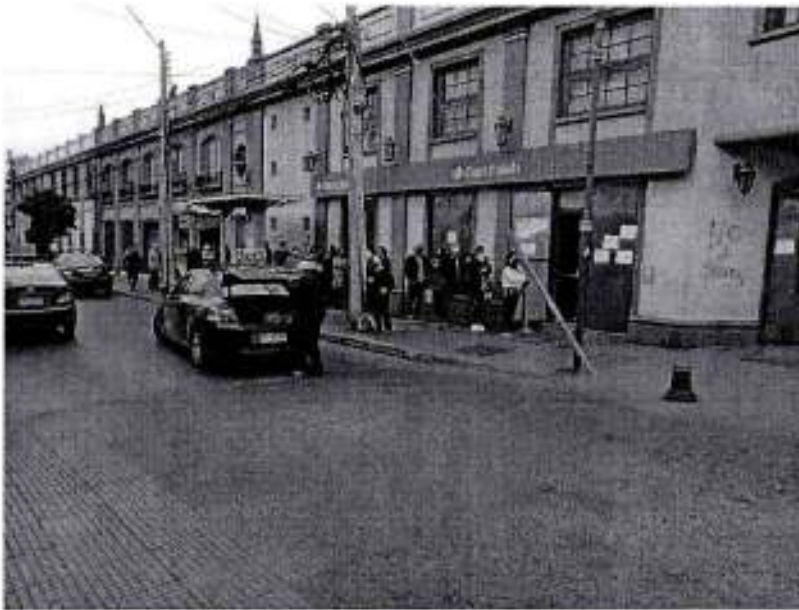
F7 Fila espera atención BancoEstado, paradero transporte público.

Fila bien ubicada apegada a la pared, indicación seremi a militares para ordenamiento.