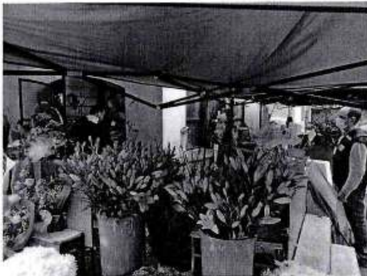
F13 Local comercial, refuerzo uso de mascarillas en vendedores.