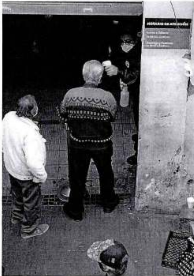
F15 entrada SERVIPAG, control temperatura y aplicación alcohol gel.