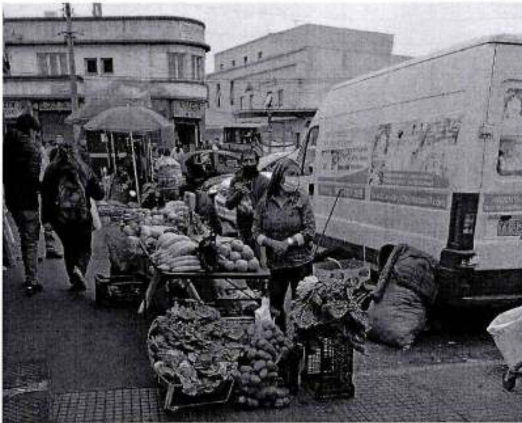
F4 Ambulantes en estacionamiento Calle Rengifo