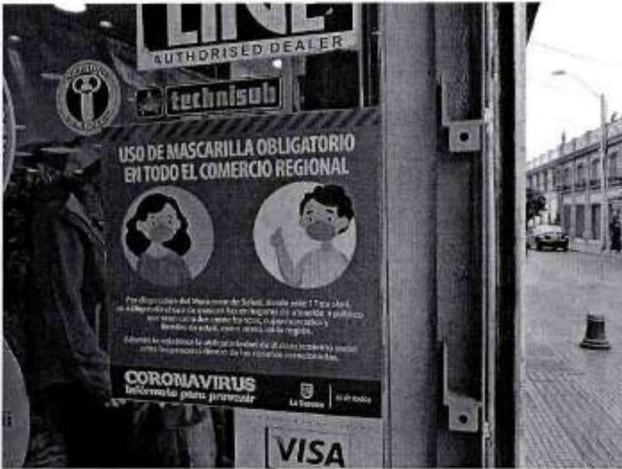
F6 Señalética comercio uso mascarillas