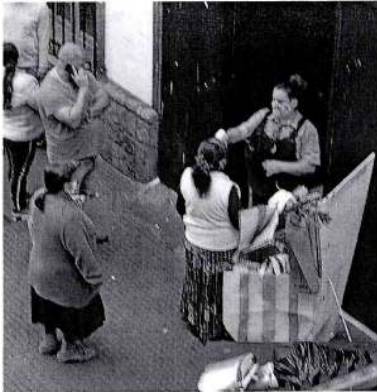
F12 Supermercado Unimarc Control Temperatura.