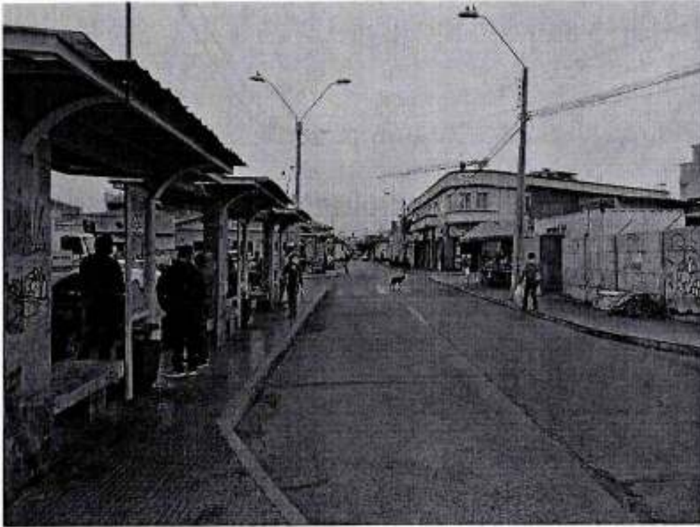
F1 Paradero Calle Rengifo