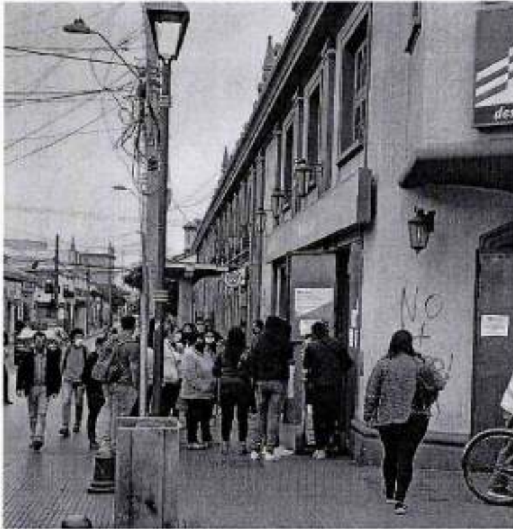
F11 Fila BancoEstado, sin orden y entorpeciendo tránsito peatones, sin demarcación en suelo