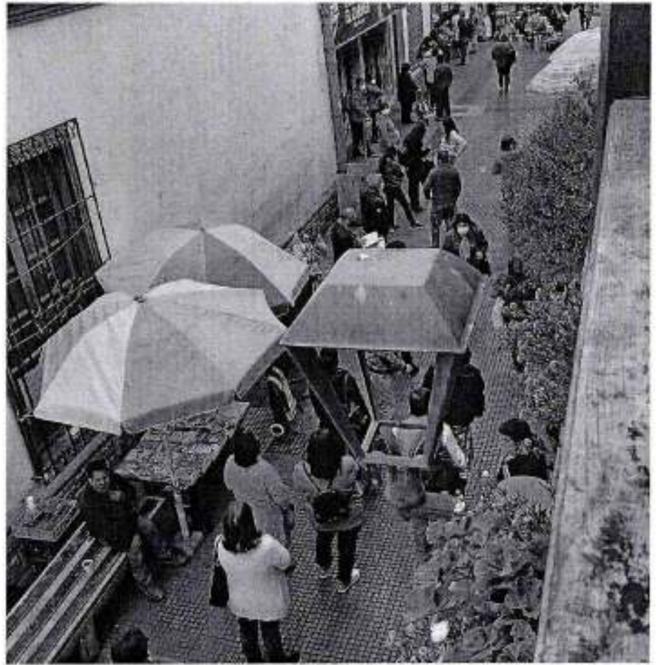
F3 Fila espera atención SERVIPAG, pasaje Zorrilla