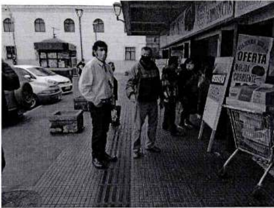
F14 Carnicería evaluación descarga de productos y condiciones de uso separadores acrílicos.