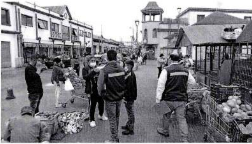
F10 Ambulantes en Calle Cienfuegos.