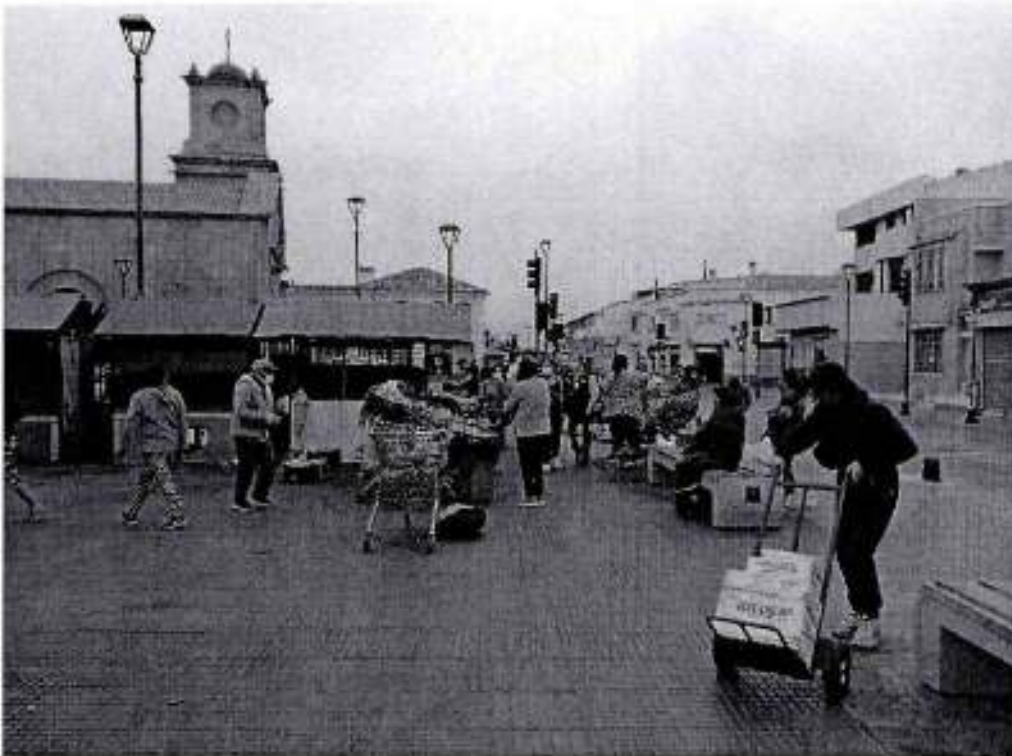
F2 Ambulantes en Calle Cienfuegos