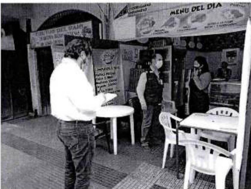
F9 local comida rápida con mesa para consumo in situ.