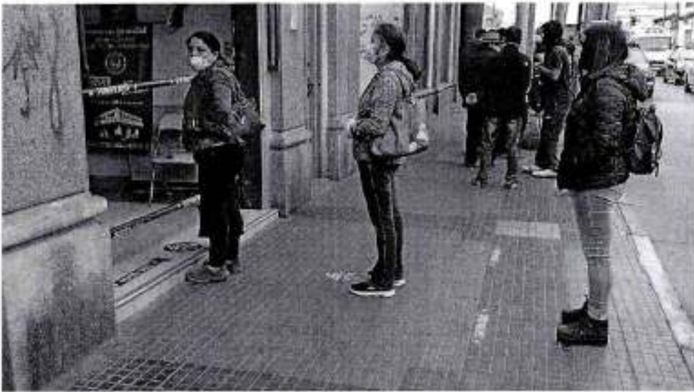
F8 Local en calle Zorrilla demarcación, mejorar orientación para no interrumpir desplazamiento por vereda.

Fila bien ubicada apegada a la pared, indicación seremi a militares para ordenamiento.