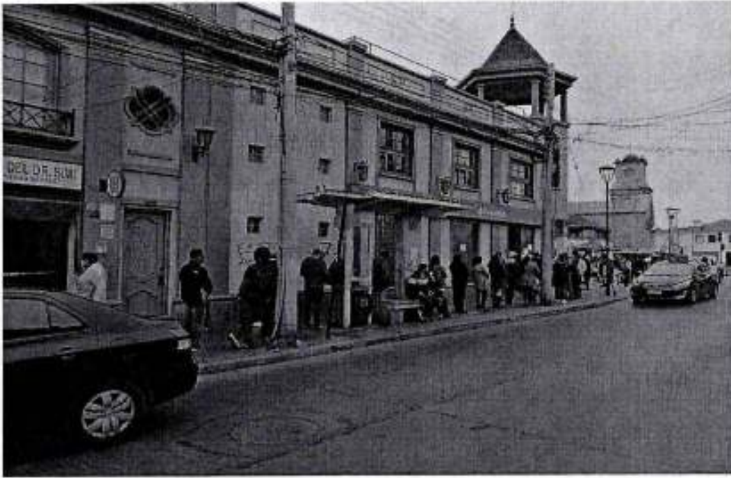
F5 Fila espera atención BancoEstado, paradero transporte público. Fila mal ubicada cubriendo paradero.